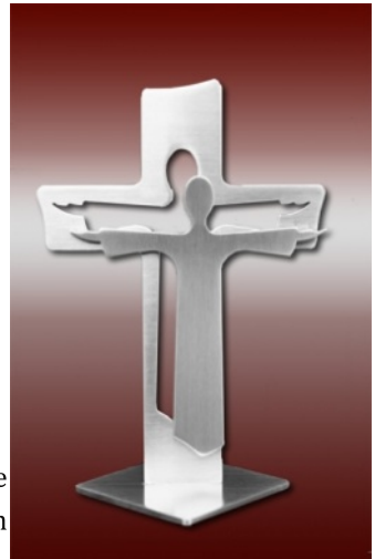
Auferstehungskreuz des CVJM Haag

Diese Gemeinden sehen es so: Nicht nur der furchtbare Tiefpunkt am Kreuz gehört zur Passion des Jesus von Nazareth – sein ganzes Leben war ein Leiden.