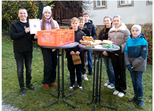
Text und Foto: Renate Wolf